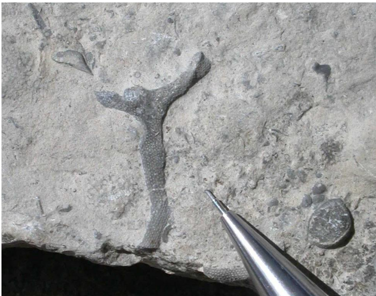
Figure 4. Un exemple de la faune marine d'il y a 450 millions d'années sur ce site. Le bryozoaire, animal mou, vivant dans un squelette calcaire constitué de nombreuses loges. Il existe, encore aujourd'hui, au moins 5000 espèces de bryozoaires.

sensiblement la même. Cependant, deux choses nous indiquent des changements profonds : les calcaires et les trilobites.