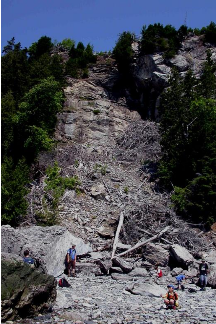
Figure 2. Aspect du géosite LM 6, constitués de blocs au bas d'un éboulement sur le bord du rivage