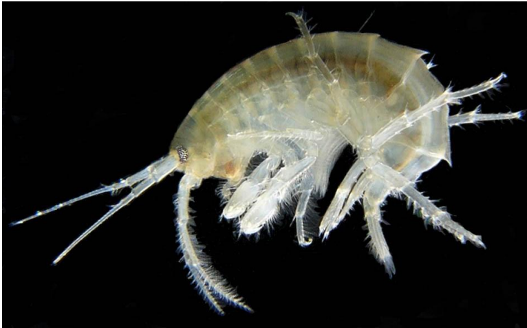
Figure 3. Un exemple de la faune marine actuelle sur ce site. Le gammare, un crustacé protégé par un exosquelette de chitine.

la faille du Saint-Laurent, avec un escarpement qui le sépare du Bouclier canadien (cf. le site décrivant la discordance du cap à la Baleine). A priori, la faune marine devrait être