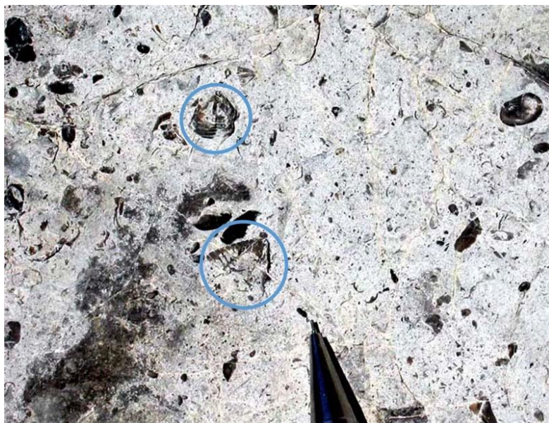
Figure 5. Fragments de trilobite dans le calcaire du cap à la Baleine.

D'autre part, on observe dans les blocs fossilifères du cap à la Baleine, des espèces qui n'existent plus aujourd'hui. Le trilobite est le plus intéressant (figure 5).